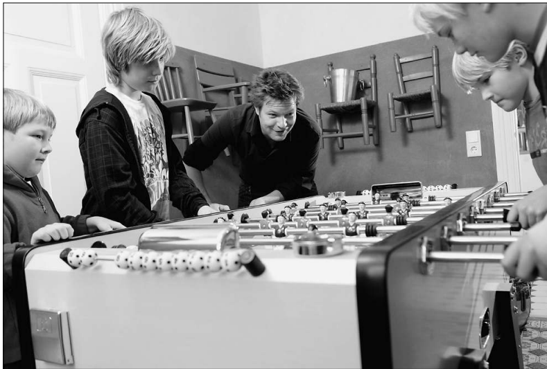
... und in der Freizeit. Die Kinder werden gemeinsam erzogen. Hier am Start mit seinen vier Söhnen

Rahmenbedingungen so ändern, dass wir zeigen: „Ihr täuscht euch alle, es funktioniert“, dann werden die Veränderungsfreudigen den Fortschritt der letzten zwanzig Jahre wieder einstampfen und als Verirrung der durchgeknallten Achtundsechzigerlinken stigmatisieren.