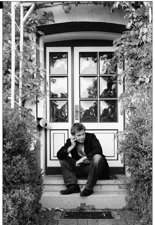
Familie und Beruf unter einem Hut: erweitertes Arbeitszimmer draußen vor der Tür

Habeck und Familie leben in Großewiehe (2.900 Einwohner), nahe der dänischen Grenze. Zum taz-Gespräch traf er sich mit Redakteur Peter Unfried auf halbem Weg – im Hamburger Hauptbahnhof.