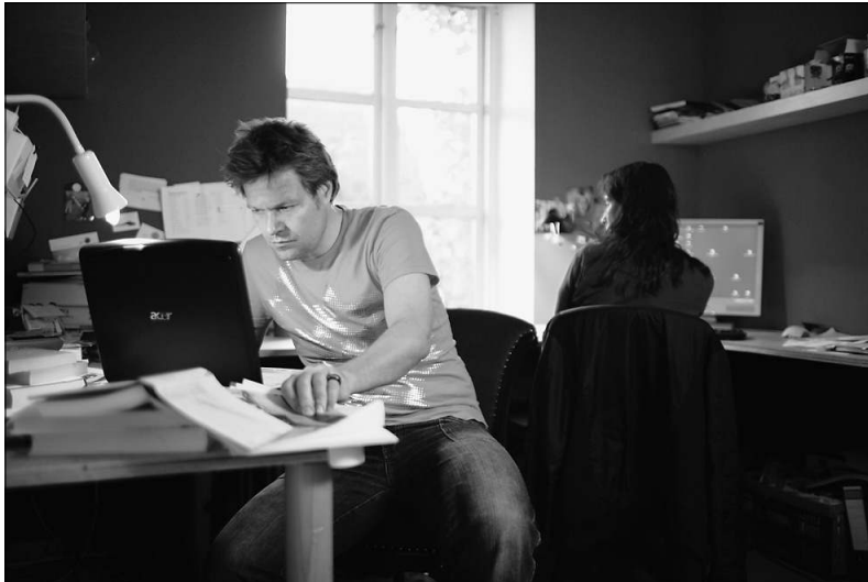
Robert Habeck und seine Frau arbeiten als Schriftsteller zusammen von zu Hause aus. Gemeinsamer Alltag bei der Arbeit ...