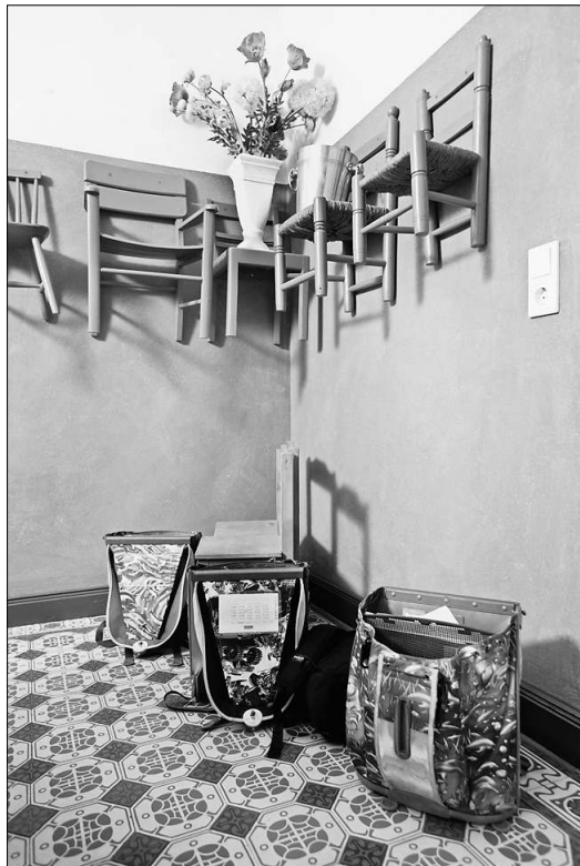
Zwischen den Stühlen: der Mann als sensibler Vater und erfolgreicher Ernährer?

Die Gegenüberklärung à la Eva Herman, Matthias Matussek oder Bernhard Bueb hat jedenfalls höhere Verkaufszahlen als ich. Ihre These ist dabei nur: Männer sind groß und stark, und Frauen sind klein und schwach, und das kann nicht anders sein. Wenn wir jetzt nicht die